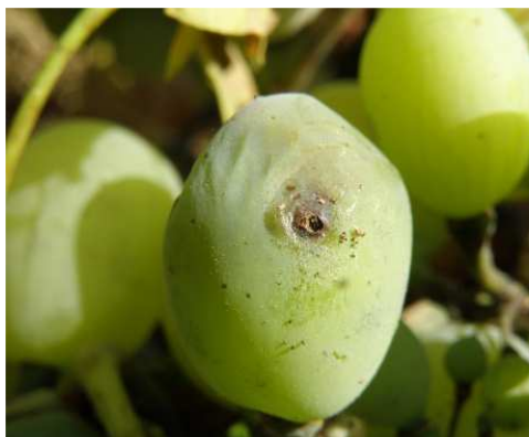
Ευδεμίδα. Προσβολή σε ράγα.