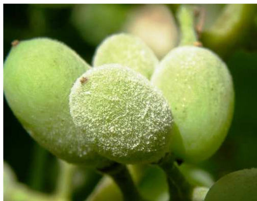
Ωίδιο. Προσβολή και αλευρώδες χνούδι (σπόρια) σε νεαρές ράγες.

Πληροφορίες: Νικόλαος Ι. Μπαγκής – Ευάγγελος Α. Αλατσατιανός