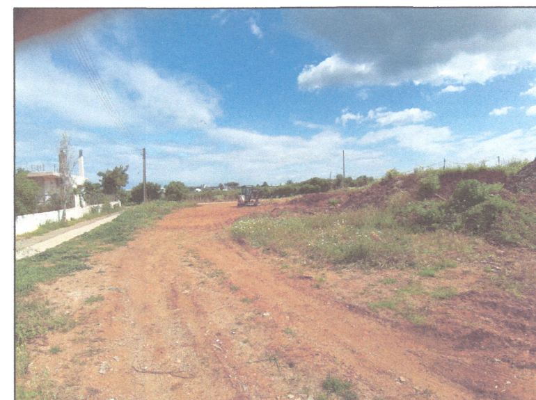
Θέση λήψης φωτογραφίας 5